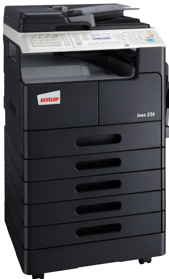
ineo 226 met duplex documentinvoer (DF-625), faxfunctionaliteit, duplexeenheid (AD-509), extra papierladen (PF-507) en staander (DK-708)

Gebruikers worden vaak overspannen bij het gebruik van moderne en multifunctionele kantoorapparaten. Ook hier vormt de ineo 226 een aangename uitzondering omdat dit model speciaal werd ontworpen voor gebruiksgemak. Een gebruiksvriendelijk menu op het display begeleidt gebruikers bij alle systeemfuncties, zodat ze in één oogopslag kunnen zien wat ze moeten doen.